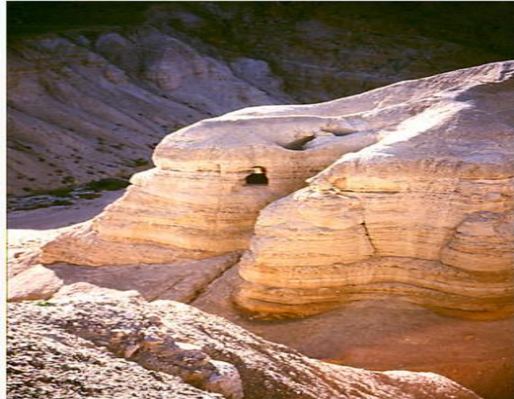
Cuevas cercanas a Qumrán

Lista indicativa del Patrimonio de la Humanidad